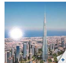
Burj Dubai (JAE)