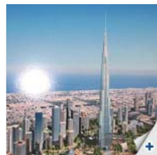
Burj Dubai (UAE)