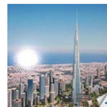
Burj Dubai (UAE)